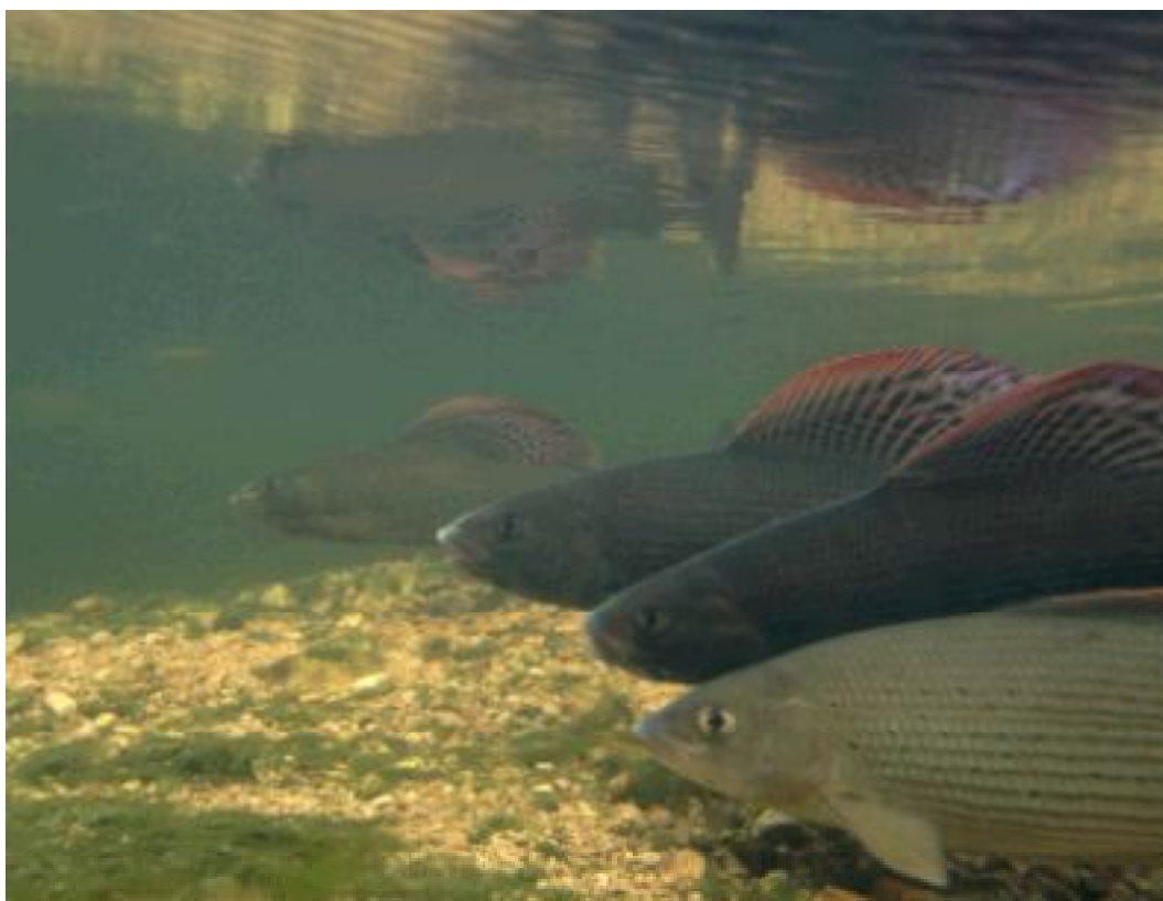
Figure 2.2. Ombres mâles et femelle sur un site de reproduction de l'Orbe. Au premier plan on aperçoit une femelle (robe claire) et au second et troisième deux mâles (robe sombre). L'ombre à l'arrière plan est également un mâle.

L'ombre est un poisson à forte croissance. À l'âge d'un an, il mesure de 10 à 18 cm, à deux ans de 20 à 34 cm et à trois ans de 25 à 40 cm (synthèse in GUTHRUF, 1996). Dans le canton de Vaud, les plus grands individus atteignent 50 à 60 cm, pour un poids approchant 2 kg. Ces grands et vieux individus se retrouvent notamment dans l'Orbe (Vallée de Joux) et dans la Versoix. Le plus gros ombre capturé en Finlande pesait 6,7 kg (ELORANTA, 1985). La maturité sexuelle est atteinte entre 2 et 4 ans. L'âge maximum est de huit à dix ans en général, mais peut atteindre 27 ans (MÜLLER, 1961 ; PETERSON, 1968; HAUGEN, 2000).